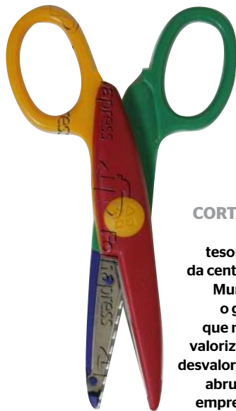
CORTANTE Uma tesourinha da centenária Mundial e o gráfico que mostra valorização e desvalorização abrupta da empresa em cinco meses

A valorização da Mundial estava atraindo tanta gente que a ação dessa pequena e centenária fabricante gaúcha de alicates de unha e tesouras chegou a ser mais negociada do que a da Petrobras. Depois da queda, a CVM recebeu uma denúncia anônima contra três corretoras, um dirigente da Mundial e um operador de bolsa. De acordo com a denúncia, esse operador teria comprado 10 milhões de ações para